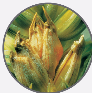
Grâu – fuzarioza spicului