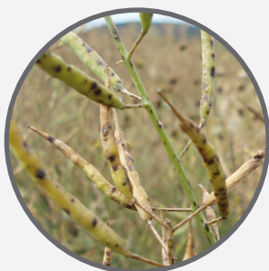
Rapiță – alternaria