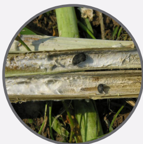
Rapiță – sclerotinia